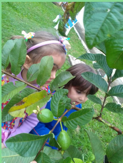
Observação da goiabeira do pátio da escola