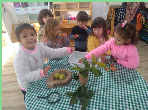
Degustação da goiaba